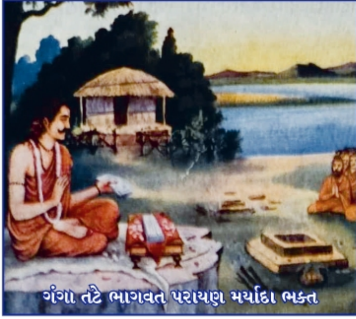
ગંગા તટે ભાગવત પરાયણ મર્યાદા ભક્ત

પુષ્ટિમાર્ગમાં પ્રભુનો અનુગ્રહ જ નિયામક છે.